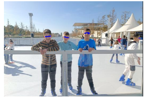
Στο παγοδρόμιο του Ιδρύματος Στ.Νιάρχος

Αμέσως μετά ξεκινήσαμε μια περιοδεία γύρω από τη Βουλή. Επισκεφτήκαμε την Προεδρική Φρουρά, το Προεδρικό Μέγαρο, το Μέγαρο Μαξίμου και καταλήξαμε στο Καλλιμάρμαρο Στάδιο. Εκεί ο κύριος Κόκκαλης μας μίλησε για την ιστορία του Σταδίου, ενώ είχαμε την ευκαιρία να μπούμε μέσα και να πατήσουμε στο ίδιο χώμα που πάτησε και ο Σπύρος Λούης, ο Χρυσός Μαραθωνοδρόμος των πρώτων σύγχρονων ολυμπιακών αγώνων.