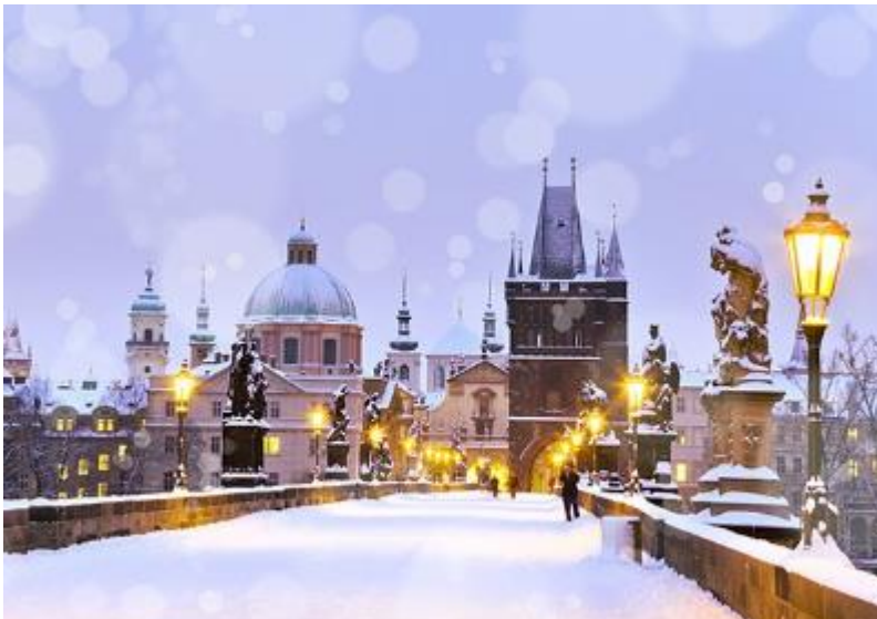
Χριστούγεννα στην Πράγα

Τα κλαδιά της κερασιάς μαζί με μικρά φυτά Αλεξανδριανών και άλλα γιορτινά στολίδια τοποθετούνται μέσα σε ψάθινα καλάθια, συνθέτοντας δημιουργίες παραδοσιακού και μοντέρνου στυλ που κοσμούν το γιορτινό τραπέζι.